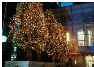
▲銀行前のイルミネーション

昨年十二月一日(木)から今年一月九日まで、GTライトアップイルミネーションがGT広場を華やかに照らし道行く人を癒していました。中目黒冬の風物詩「中目黒あかりまつり2011」のステージの開幕でした。昨年で七回目を迎えたあかりまつりは、十二月十二日から同月二十五日まで、新しい演出を取り入れて、柔らかな「あかり」を表現しました。新しいあかりまつりを写真でつづってみました。