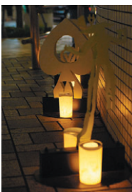
▲ロウソクの優しい灯