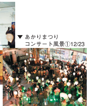
▼あかりまつりコンサート風景①12/23