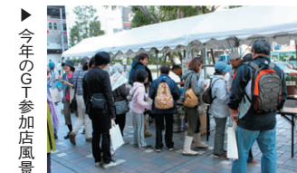
▲今年のGT参加店風景

天でのスタートでしたが、後半は雨も上がり、ステージでは吹奏楽やビンゴゲーム、阿波踊りなどが披露され、GT敷地内全体でバザー出展ブース等が賑わっていました。