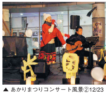
▲あかりまつりコンサート風景②12/23