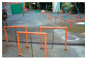
▲ GT側から見た児童遊園入り口

中目黒駅近く、東横線高架の横に、目黒銀座児童遊園があります。地域の子供たちの遊び場として親しまれてきましたが、長年の使用により、荒れてきております。そこで、本来の児童遊園に戻そうと、昨年九月に地元の上二東町会、中目黒会長をはじめとして、「目黒銀座児童遊園を良くする会」を