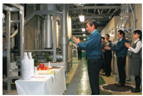
▲ ボイラー室での安全祈願風景

中目黒GTの火の安全を祈願する、ボイラーの火入れ式が十一月十一日(金)九時半から、GTタワービル地下のボイラー室で行われました。