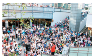
▲マジックのマジックのステージ風景

十月十六日(日) GTプラザ商店会主催のオートムフェスティバル2011が行われました。当日は、マジックのマジックをゲストに、バルーンアートや、抽選会、ヨーヨー釣りなど約600人が楽しんでいました。また、同時開催のなかめオートムフェスタGT会場では、飲食をはじめとしたブース