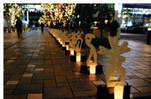
▲GT広場の古代の行列