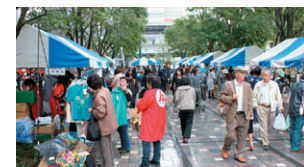
▲福祉の集い、バザー風景

十月二十二日(土)、GT敷地内を会場として、目黒区社会福祉協議会主催による第九回めぐろ地域福祉のつどいが開催されました。当日は午前十時から開会式、雨