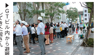
▲GTビル内から避難してきた皆さん

十一月四日(金) 午後二時から、GT全館避難訓練が行われました。GT各テナントの社員の皆さん、店舗従業員の皆さん、お住まいの皆さん、など約七百名が短時間にタワー前広場に避難しました。点呼後に、講評があり無事終了しました。