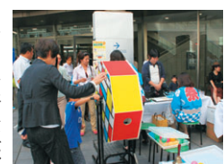
▲オートムフェスティバルの抽選会風景