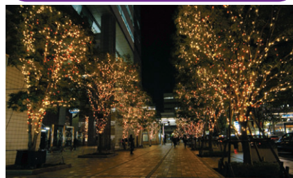
▲ライトアップイルミネーション 12/1～1/9