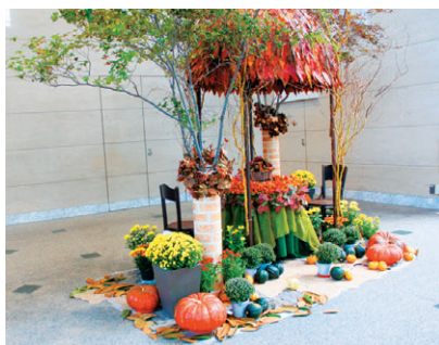
▲ 昨年23年の秋のイメージ

GTオフィス棟では、十月三日から十一月十八日まで、秋のイメージを飾りつけました。毎年、新しいデザインでのこの飾りは、テナントにお勤めの皆さんのひと時の癒しとなっています。