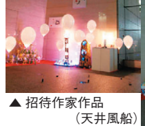
▲招待作家作品 (天井風船)