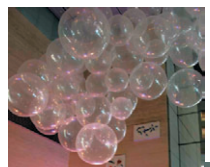
▼ツリー展展示作品、手前がグランプリ作品