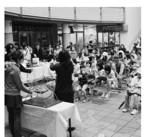
▲人気のビンゴゲーム大会(昨年)

ファッションショー 午後四時三十分～六時 スペシャルライブ【I】 十月十八日(日) 時間 午前十二時～午後四時