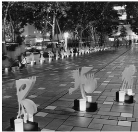
▲人気定着の「古代の行列」も今年で6年目(写真は昨年)

詳細は、「私のクリスマスツリー展」事務局(株)アートフロントギャラリー内 電話三四七六―四八六八へ