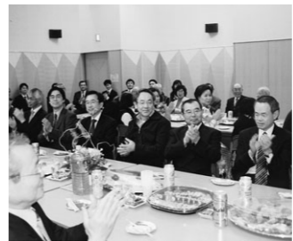
▲ 昨年の賀詞交歓会の様子