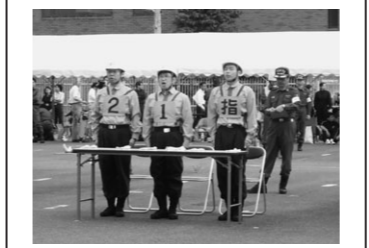
▲ 迅速できびきびとした迫真の演技

自衛消防活動審査会は、目黒区内にある学校やホテル、ショッピングセンター、企業などが、自身の建物や在館者、来館者を、火災や災害から守るために、各所で自衛消防隊を組織し、優秀な演技の隊は表彰をされるという大会です。今年の参加隊は、全部で31隊。中目黒GTの防災センタースタッフも竣工以来、連続8回目の出場を果たし、奮闘!敢闘賞をいただきました。